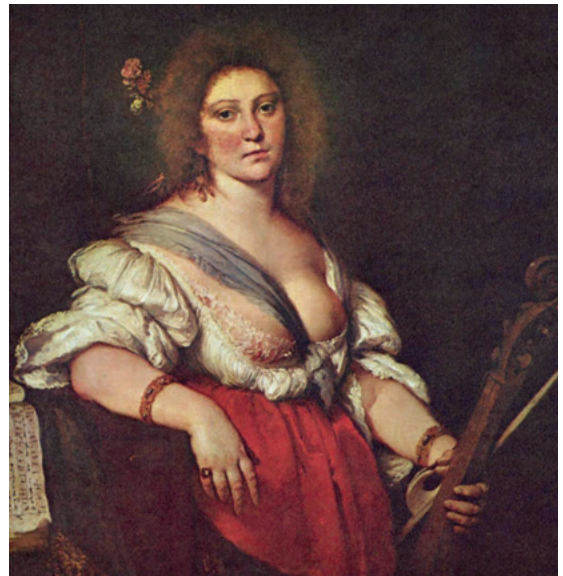
Eine Gambenspielerin von Bernardo Strozzi

„ (...) uno de piu celebri di questo secolo, gia dalla mia fanciullezza mio cortese precettore (...)“ – „ (...) einer der berühmtesten dieses Jahrhunderts, seit meiner Kindheit mein freundlicher Lehrer (...)“.