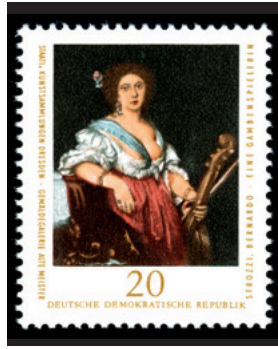
20 Pfennig Briefmarke der DDR

In der MGG findet sich ein ausführlicher Artikel über Leben und Werk der Komponistin, ebenso gibt es zahlreiche Aufsätze und wissenschaftliche Arbeiten, eine Monographie der Komponisten liegt allerdings bislang nicht vor. Ein kurzweiliges, facettenreiches und gleichzeitig sehr informatives Portrait über Barbara Strozzi vom Mai 2025 ist in der Reihe Komponistinnen im Fokus in der WDR-Mediathek anzuhören.